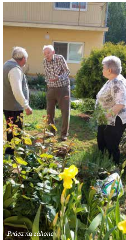
Práca na záhone