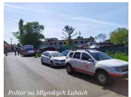
Požiar na Mlynských Luhách

Pomocou prepravnej služby SČK Bratislava – mesto bola 30. apríla zabezpečená preprava osôb