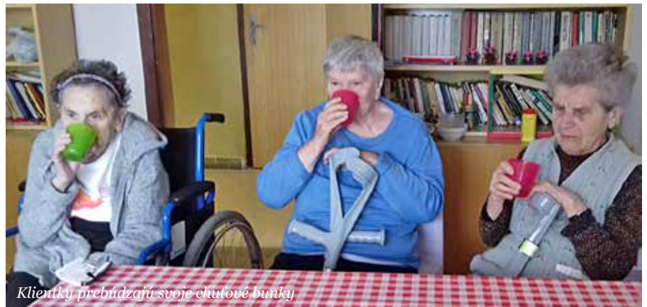
Klientky prebúdzajú svoje chuťové bunky

Februárové dopoludnie v obvyklom čase pravidelného stretávania našich klientov sme v Stredisku evanjelickej diakonie v Sučanoch trávili spoločne pri čaji. Rozhodli sme sa klientom pripraviť stretnutie zamerané na nápoj, ktorý je hneď po vode tým najviac rozšíreným. Možno sa nám zdá tento nápoj obyčajný, je dostupný aj v našom zariadení počas každodenného stravovania. Je bežnou súčasťou pitného režimu a sprevádza ľudí počas celého života. Pre niekoho je to osviežujúci nápoj na zahnanie smádu, pre iných zas jeho prípravu spájajú jasne stanovené čajové obrady. Dozvedeli sme sa, že dejiny čaju sa začali písať pred 5000 rokmi v Číne a vraj podľa legendy ob-