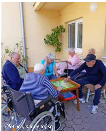
Človeče, nehnevaj sa

Naši klienti sa spoločne s ostatnými obyvateľmi tešili z bohatého kultúrneho programu, ktorý sprevádzal stvanie mája. Deti z folklórnej skupiny Hrozienska vyčarili na tvárach všetkých prítomných úsmev a priniesli radosť do všedného života.