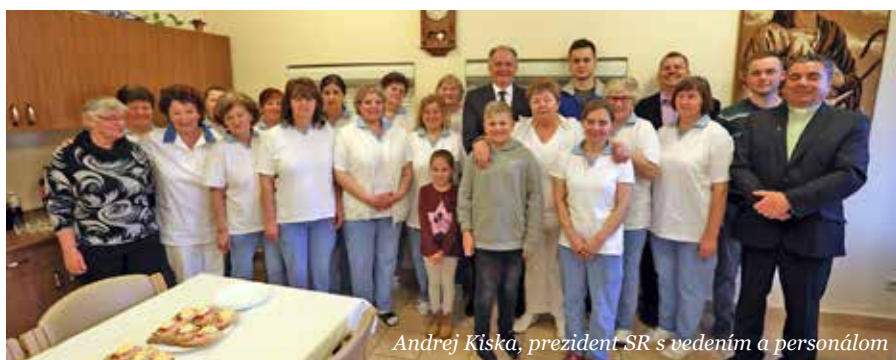
Andrej Kiska, prezident SR s vedením a personálom

Hlava štátu – prezident Slovenskej republiky Andrej Kiska so sprievodom, navštívil v rámci svojho pracovného programu vo štvrtok 14. marca 2019 Ilavský okres, kde sa stretol s predstaviteľmi samospráv z regiónu. V popoludňajších hodinách zavítal aj do Strediska evanjelickej diakonie v Košeci, v ktorom sa uskutočnilo milé stretnutie s jeho obyvateľmi a personálom.