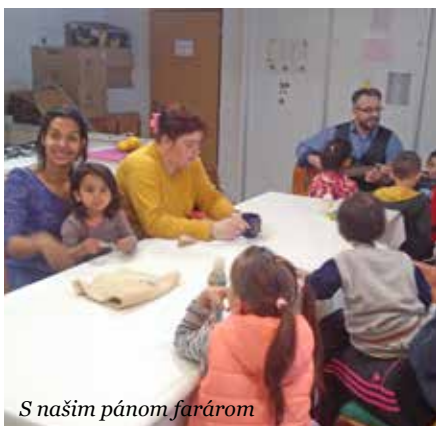
S našim pánom farárom

Čas plynie veľmi rýchlo. Len nedávno sme sa pripravovali na vianočné sviatky a už sa tešíme s našimi najmenšími obyvateľmi na leto a na letné prázdniny. Určite ste zvedaví, ako sa nám v SED Horná Mičiná – DEBORA útulok pre matky s deťmi darí a čo sme všetko zažili.