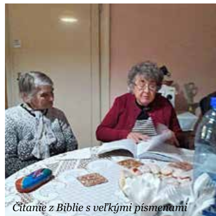
Čítanie z Biblie s veľkými písmenami