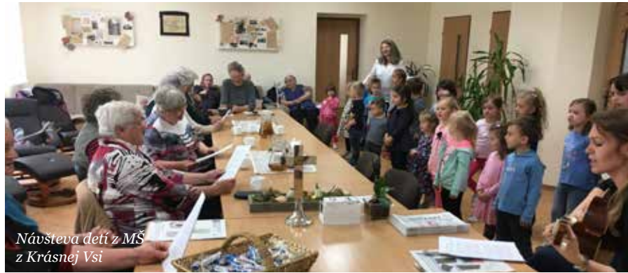
Návšteva detí z MŠ z Krásnej Vsi

Ďakujeme Pánu Bohu, že sme cítili Jeho prítomnosť a požehnanie medzi nami.