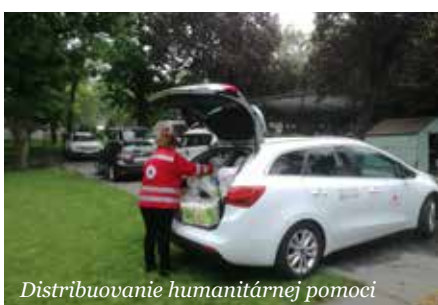
Distribúovanie humanitárnej pomoci