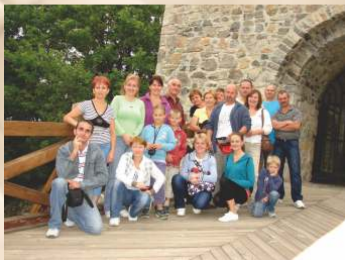
Kolektív SED Kšinná so svojimi blízkymi

Nech sme vždy Tvojím vlastníctvom, nech s každým novým dňom stojíme v Tvojej službe, Pane. Do Tvojej vôle odovzdané ako pokorné Tvoje deti, ktorým vždy Tvoja láska svieti.