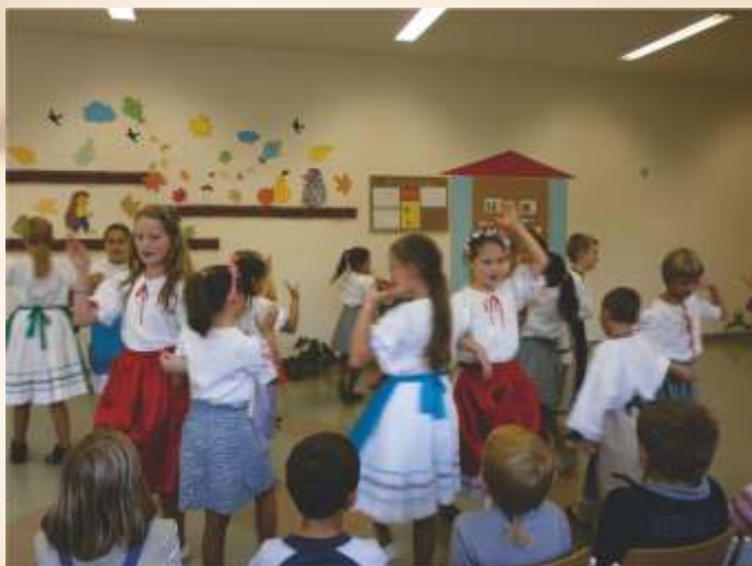
Program detí ZŠ

Deti a seniori už akosi patria k sebe. Aj keď je medzi nimi značný vekový rozdiel, je veľmi pekné, keď nájdú spoločnú reč a dokážu jeden druhého potešiť.