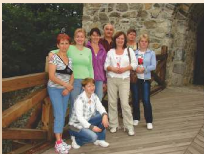
Kolektív SED Kšinná

V našom pracovnom svete nemáme veľa času na osobné rozhovory, stretávanie sa... Ale na takýchto rodinných stretnutiach vzniká priestor pochváliť toho druhého, oceniť prácu kolegyne, prejavíť uznanie, na ktoré už jednoducho v dnešnej dobe nie je čas. V našom domove nezabúdame na ľudskosť a kresťanský prístup. Božie prikázania sú nám smernicou k životu.