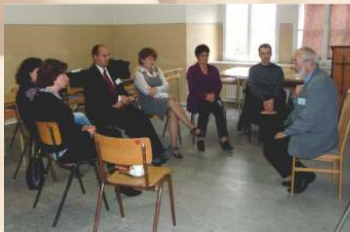
Jeden z workshopov

Cieľom podujatia bolo zdieľať súčasné trendy a skúsenosti v práci so seniormi a v problematike medzigeneračných vzťahov.