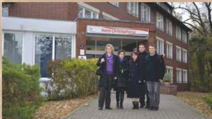
S partnermi zo Srbska