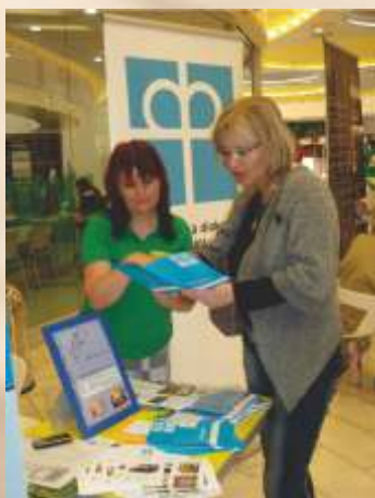
Prezentovanie aktivít ED

Veríme, že sa nám účasťou na Veľtrhu sociálnych aktivít podarilo poukázať na to všetko čo v oblasti materiálnej i duchovnej pomoci robíme pre ľudí v núdzi.