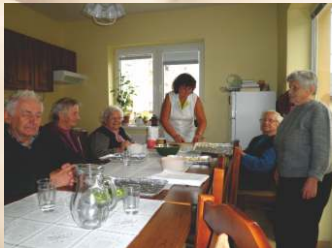
Spoločné chvíle pri pečení

V SED Vranov nad Topľou sa naši klienti ocitajú už na prahu jesene života. Nie je to však koniec ich životnej aktivity. Počas pobytu v dennom stacionári sa venujú rôznym záľubám: okrem denného stíšenia a spievania kresťanských piesní, sa venujú vareniu, pečeniu a pleteniu. Pletú z použitej vlny krásne deky, hačkujú rôzne dečky atď. V období pred Vianocami pečú tiež vianočné oplátky a opekance.