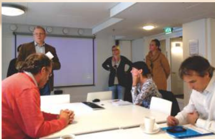
Predstavenie projektu Housing First

Medzinárodné stretnutie s témou sociálnych inovácií pod názvom Social innovation: Study visit and workshop, zorganizovala Eurodiaconia v spolupráci s Helsinki Deaconess Institute. Stretnutie sa konalo v dňoch 18.- 19. septembra 2012 priamo na pôde Helsinského diakonického inštitútu vo Fínsku, Helsinkách.