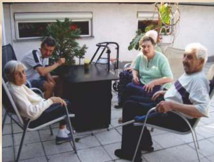
Posestie klientov na terase

Starnúť v kruhu rodiny je pre človeka to najlepšie. Keď sa však dostaví choroba, alebo núdza a z rodiny sa nikto nedokáže o starého a chorého blízkeho postarať, SED Horné Saliby ponúka pomocnú ruku. „Sme tu pre nich – pre klientov“ – dalo by sa povedať, že je to heslo zamestnancov strediska. Naše zariadenie, čo sa týka počtu klientov, je skôr rodinného typu. Snažíme sa im vytvárať podmienky, aby starobu nevnímali ako „trápenie sa na svete a byť na obtiaž“.