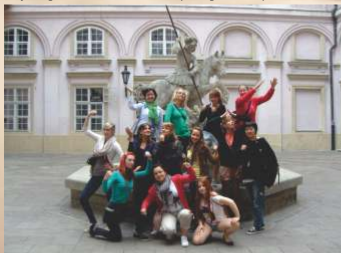
Hrdinky v Primaciálnom paláci

Absolvovali sme plavbu loďou do Viedne, kde sme navštívili múzeum Albertina. Po prehliadke sme mali čas, ktorý sme mohli využiť na objavovanie pamiatok vo Viedni.