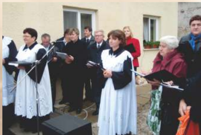
Posviacka SED „Prameň“

Proces starnutia uzatvára vývojovú etapu každého človeka. Je to nesmierne zložitý proces, ktorý je však výsostne individuálny. Zároveň je to