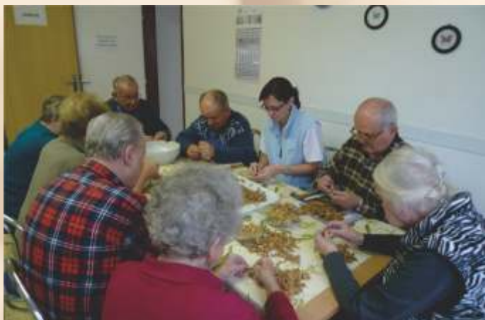
Ergoterapia - lúskanie orechov

Viacerí uznávaní autori v oblasti starostlivosti o seniorov poukazujú na nevyhnutnosť udržať si aktívny spôsob života čo možno najdlhšie. I v našom zariadení SED – Sučany máme skúsenosť, že je dôležité napomáhať klientom udržať si aktívny spôsob života. Usilujeme sa o znižovanie stresu seniorov, podporujeme ich vo vedomí, že sú schopní mnohých činností, čo vedie k ich sebaúcte, motivácii žiť a byť zdravý. Snažíme sa zabezpečovať aktivizáciu prostredníctvom kultúrnej, záujmovej a pracovnej činnosti.