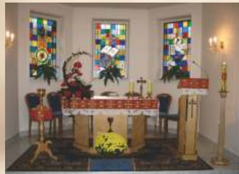
Kaplnka SED Košeca - studnica duchovného života

„Lebo Ty si mi nádejou, Pane, Hospodine, Tebe dôverujem od svojej mladosti. Nezavrhni ma v čase staroby, Ty ma neopušť!“ Žalm 71,5-9