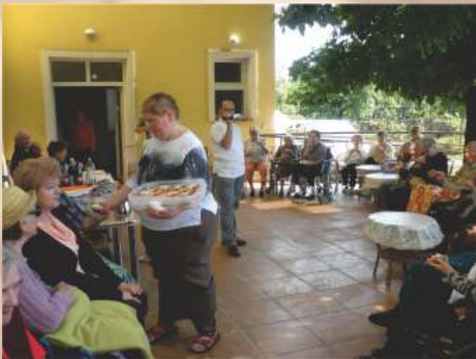
Letné posedenie na terase

V polovici septembra sme pre všetky generácie pripravili spoločné pojarmočné zábavné stretnutie. Cigánska, divinový guláš, koláčiky, hudba, spev, tanec. To, čo predviedla stálica slovenskej populárnej scény – Jadranka, sa slovami nedá opísať. Náš 98. ročný klient sa zvrátil s mladým dievčaťom so stacionára na pódium ako vo finále Star Dance.