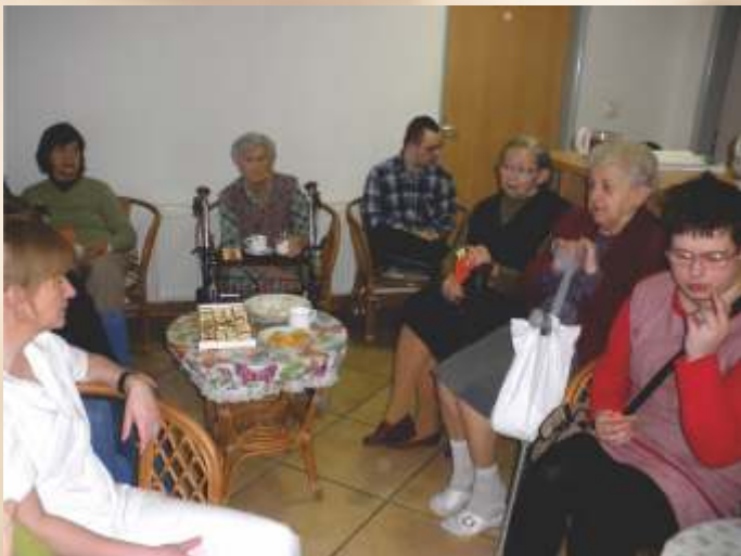
MDŽ v SED Trnava