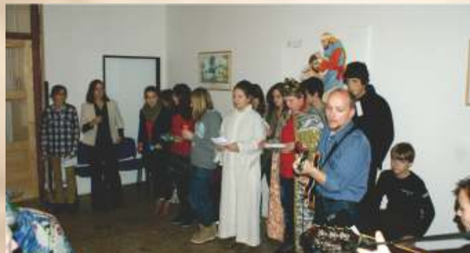
Deti z EZŠ v Martine

Počas uplynulých dní sme zrealizovali v Dome Dobrého Pastiera viaceré zaujímavé stretnutia a činnosti, ktorých cieľom bolo spríjemnenie voľných chvíľ seniorov, prehĺbenie vzťahov, podpora pohyblivosti a zmyslovej aktivity. Teplé letné dni, počas ktorých sme trávili spoločné chvíle na čerstvom vzduchu a slniečku sa pominuli a prišla jeseň. Prichádzajúcemu jesennému času sme prispôbili aj aktivizačnú a terapeutickú činnosť. Využili sme možnosti, ktoré nám ponúka toto ročné obdobie - obdobie dozrievania, zberu a spracovávania plodov. A tak sme sa pustili do lúskania orieškov, čistenia jabĺčok a tlačenia kapusty. V príhodnej chvíli orechy, jablká i kapustu zužitkujeme, či už na pečenie alebo si len tak na nich pochutnáme.