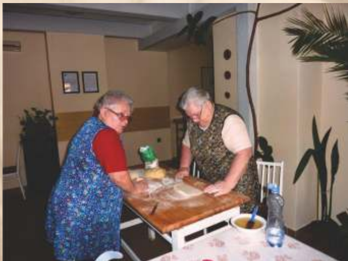
Voľnočasová aktivita klientov

Aj starnúci človek túži naďalej cítiť svoju užitočnosť, má potrebu vlastnej sebarealizácie a my ich v tom podporíme, lebo starnúť neznamena prestáť žiť!