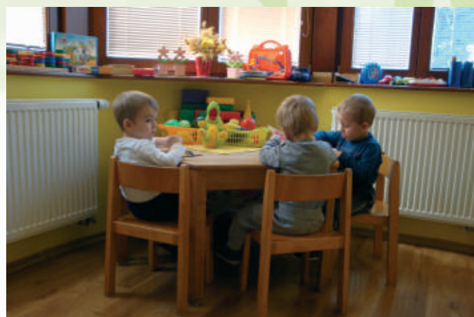
Rozvíjame svoju zručnosť

Nezazlievam im to. Teraz po rokoch smiem s plnou vážnosťou povedať a zároveň vysloviť aj poďakovanie všetkým bratom a sestram v našom cirkevnom zbore, že dali tomuto neštandardnému projektu šancu a čas ukázal, že to bolo správne. Začiatky vôbec neboli jednoduché, ale vďaka Pánu Bohu všetko sa dalo prekonať a zvládnuť.