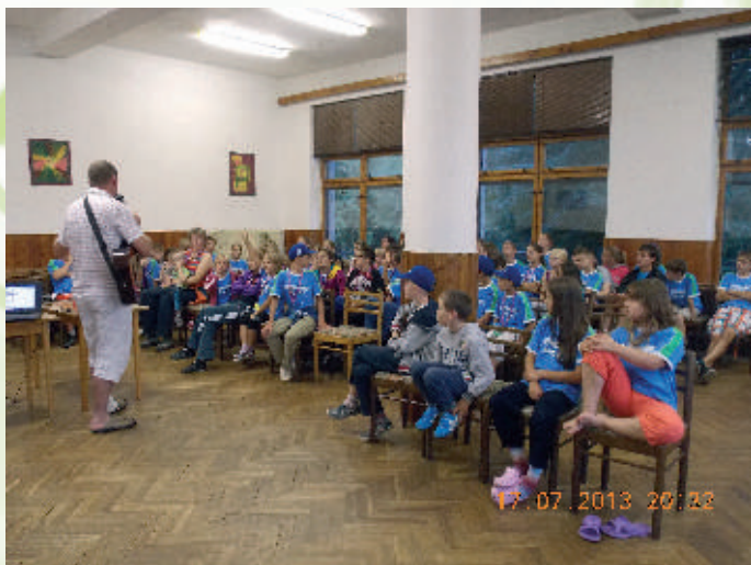
Nácvik piesní tábor Račkova dolina 2013

Prvý spoločný letný tábor sa konal v roku 2012 v Janoškovom dome v Liptovskom Hrádku. Zo Srbska prišlo 25 detí, ktoré sa veľmi rýchlo spriatelili s tými našimi a vznikli priateľstvá, ktoré im dodnes dávajú pocit skutočnej rodiny, možno takej, akú z rôznych príčin nemohli mať. Keďže priestory