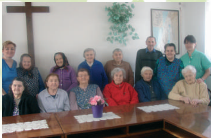
Naši klienti so svojimi sociálnymi pracovníčkami