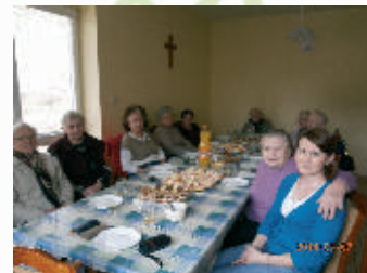
V Dennom stacionári je rodinná atmosféra

denom styku a to už od príchodu klientov do zariadenia. Spoločne sa pripravujeme na duchovné stíšenie, spoločne sa rozprávame o radoostiach, ale aj problémoch v rodinách, ktoré prináša našim klientom každodenný život. Prijemnú atmosféru dotvára vôňa domáceho koláča, kávy alebo čaju, na príprave ktorého sa podielame tiež spoločne. Celý tento rodinný kolobeh dopĺňame návštevami rodín, ktoré o našu službu majú záujem. Niekedy im stačí spoločnosť láskyplného človeka alebo drobná pomoc v domácnosti, či i len malá pozornosť, ktorá je im venovaná, aby sa necítili osamelé a izolované. Pravidelne informujeme rodiny našich klientov o dani v SED osobne, telefonicky, alebo prostredníctvom článkov v zborovom časopise Prameň.