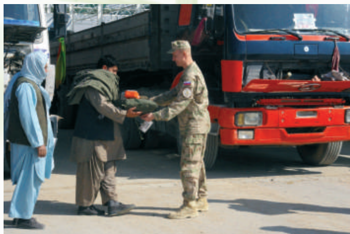
Odozdávanie humanitárnej pomoci

Na základni KAF (Kandahar Airfield) v Afganistane je čulý ruch. Denne vchádzajú a vychádzajú stovky vozidiel, ktoré vezú zásoby a najrozmanitejší tovar. Na základni s približne 20-tisíc vojakmi jazdí asi 8-tisíc automobilov. Kandahárska základňa – najväčšia základňa NATO na svete, pôsobí ako obrovské mravenisko. Mnohí z afganských vodičov kamiónov merajú cestu až z Pakistanu v náročných podmienkach, bez akejkoľvek zastávky a oddychu.