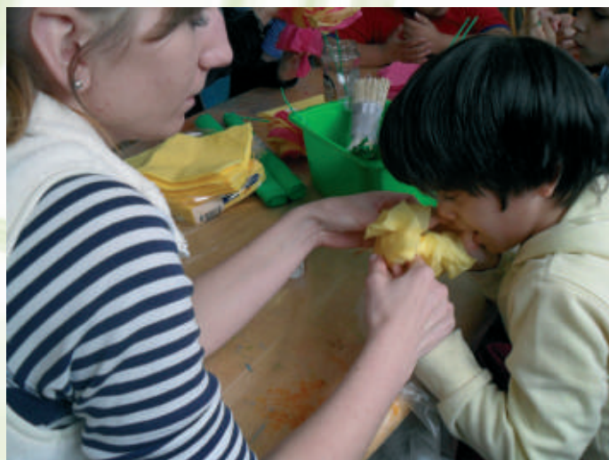
Šikovné rúčky našich detí

Pre nepriaznivé počasie sme sa hneď po rannom stíšení zišli všetci v jedálni. Tam nás na stoloch čakalo množstvo rôzneho materiálu k tvoreniu.