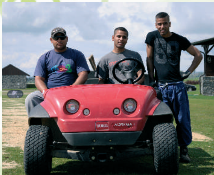
S úsmevom ide práca ľahšie

„Rodina znamená pre mňa veľa vecí: istotu, zázemie. Často ma to ťahá do Bardejova, za súrodencami. Cnie sa mi za nimi. Od rodiny som prijal empatiu, súdržnosť. Tu v zariadení sa učím zodpovednosti, mám strechu nad hlavou, som obklopený ľuďmi, ktorí veria v Boha a cez tú vieru ma posúvajú ďalej v živote, osobnostne aj pracovne.“