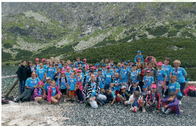
Účastníci Slovensko – srbského tábora 2013 Sliezsky dom

podporuje pobyt srbských detí na Slovensku, za čo sme úprimne vďační.