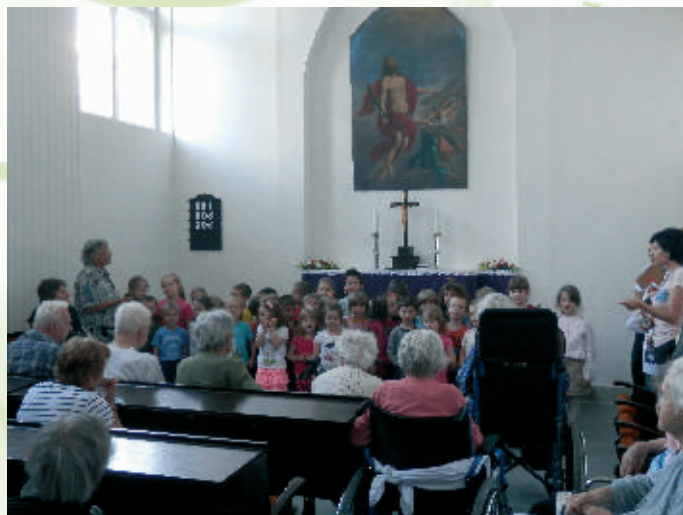
Program detí z Evanjelickej škôlky nás potešil

Koncom mesiaca si pre nás pripravili duchovné pásmo mládežníci zo spoločenstva Légie+, ktoré je tiež súčasťou CZ Legionárska. Modlili sa za nás, spievali nám, pripravili si pre nás aj scénku s biblickým podkladom a venovali sa nám aj v osobných rozhovoroch.