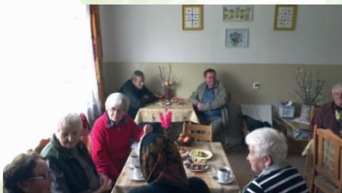
Posedenie v Dennom stacionári v Malej Čalomiji

terapiu, fyzioterapiu, odborné poradenstvo, spoločenské aktivity, kultúrne programy, vychádzky a iné.