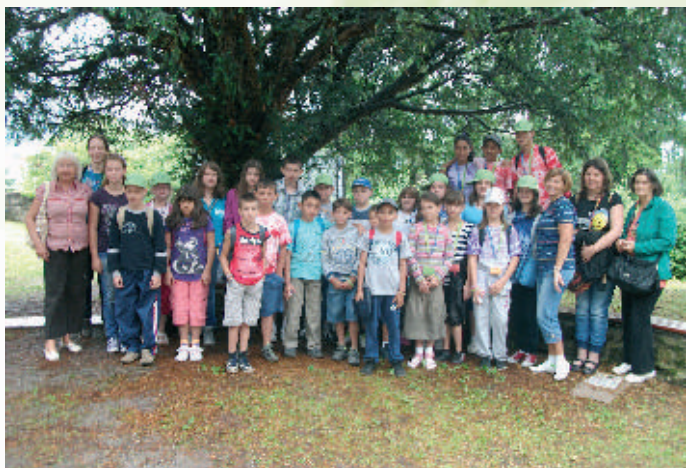
Účastníci zo Srbska na prvom medzinárodnom tábore v roku 2012

Vždy spomínam s radosťou a hrejivým pocitom pri srdci na začiatky našej spolupráce s Evanjelicou diakoniou (ED) a následne so Srbskom. Pôvodná myšlienka spolupráce vznikla v roku 2005 a súvisela aj s povodňami v Rumunsku, keď sa ED rozhodla pomôcť deťom v postihnutých oblastiach. Keďže sme už mnoho rokov predtým prijímali podobnú pomoc v podobe vianočných balíčkov pre naše deti z Nemecka a Švajčiarska, prišiel rad aj na nás, aby sme posunuli naše vlastné možnosti pomoci a podpory ďalej. Tak sme reagovali na výzvu ED a pripravili niekoľko desiatok prvých vianočných balíčkov pre deti v Rumunsku.