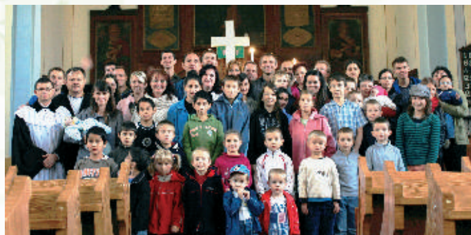
Víkendový pobyt Poronín 2013

Poskytujeme možnosť zotrvania mladých dospelých v našom Domove detí. Mladým dospelým pomáhame a pripravujeme ich na osamostatnenie sa. Príprava prebieha priebežne v profesionálnych rodinách, motivujeme a podporujeme ich v ďalšom vzdelávaní a štúdiu. Po odchode mladých dospelých z Domova detí udržujeme s nimi kontakt a poskytujeme naďalej pomoc a poradenstvo pri zabezpečení bývania, pomoc pri hľadaní práce, poskytujeme sociálne poradenstvo a pomoc pri začlenení sa do bežného života. O možnosti stať sa profesionálnymi