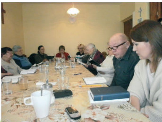
Ranné duchovné stíšenie

Nepochybne ten najväčší dar a šťastie pre človeka je rodina a zdravie. Pre seniorov je život prežitý v kruhu svojej rodiny, v blízkosti svojich najbližších tým najlepším a najvhodnejším prostredím, ktoré nesmierne ovplyvňuje ich duševné a telesné zdravie. Kedysi bolo normálne, že žilo viacero generácií spolu. V terajšej dobe sa stále menej stretávame s tým, že spolu pod jednou strechou žijú deti, rodičia a starí rodičia. Spoločný život viacerých generácií pod jednou strechou takmer vymizol.