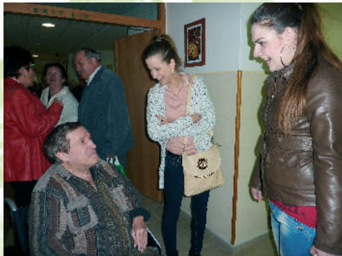
Prekvapivé, príjemné stretnutie so sestričkami

Týždeň pred Veľkou nocou zamestnanci aj klienti Domova sociálnych služieb Horné Saliby boli pozvaní na veľkonočné trhy do Zariadenia pre seniorov v Dolných Salibách. Chodíme tam pravidelne a tento rok to bol 5. ročník.