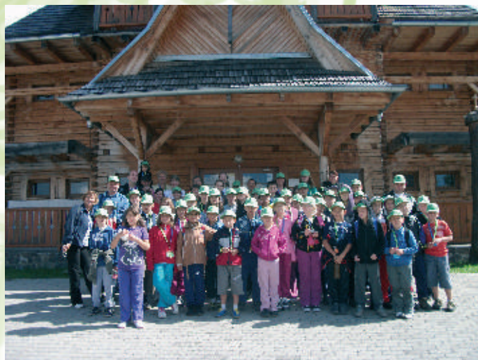
Účastníci Slovensko - Srbského tábora 2012 Východná

vania, ranných skupiniek, mnohých detských a mládežníckych piesní, výletov, športu, tvorivých dielní a ďalšieho bohatého programu. Na začiatku sme sa snažili vytvoriť skupiny tak, aby boli pomešané naše deti so srbskými, no časom sa to deje už úplne prirodzene. Na celý týždeň vytvárame jednu veľkú, pevnú a skutočnú Božiu rodinu, v ktorej sa môže každý cítiť prijatý, hodnotný a jedinečný. Celý program zabezpečuje tím vedúcich z CZ Podlužany.