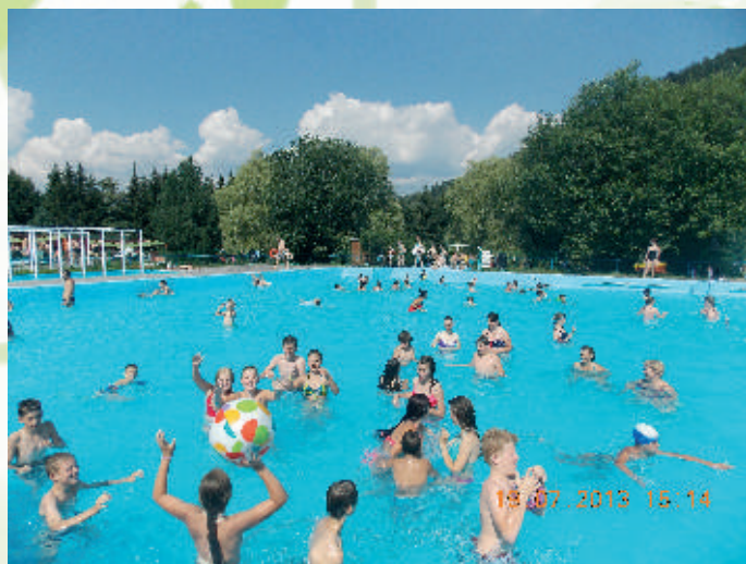
Kúpalisko Liptovský Ján 2013 tábor