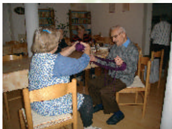
Ručné práce nás zblížujú

Seniori v SED Hontianske Moravce sa snažia stále vykonávať aktivity, ktoré im prinášajú do všedných dní niečo nové, niečo čo prináša radosť a pripomína im rodinné prostredie.