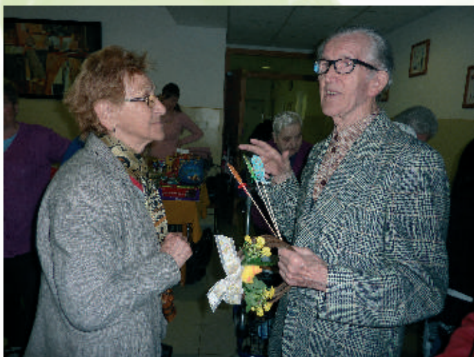
Stretnutie po 30-tich rokoch

Tento rok nás tam čakali hneď dve prekvapenia. Jeden náš klient stretol sestričky z predošlého zariadenia. Boli prekvapené, že ho tam vidia, pretože po nedobrovoľnom odchode z ich zariadenia, nemal kam ísť a stal sa bezdomovcom. Nakoniec sa nad ním zľutovala jeho sestra a s jej pomocou sa dostal k nám do zariadenia v Horných Salibách. U nás sa mu páči a je veľmi spokojný. Častokrát hovorí, že keby aj od nás musel odísť, už by naozaj nemal kam ísť.