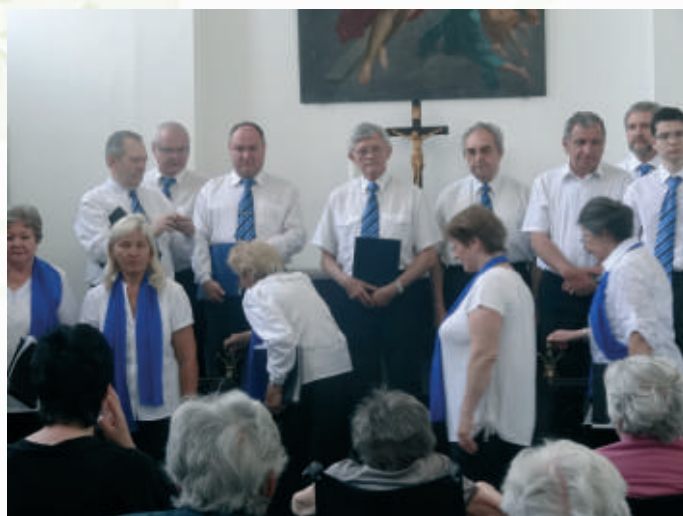
Spevokol CZ ECAV Bratislava - Legionárska

O týždeň neskôr nás navštívil spevokol z CZ Legionárska, ktorý nás potešil a občerstvil krásnymi chválami, pričom nás spevokolisti voviedli do spoločného oslavovania nášho Hospodina, požehnali nás tiež Božím slovom a modlitbami. Aj od nich sme prijali s láskou pripravené darčeky.