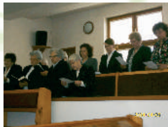
Vystúpenie klientiek v chráme Božom

Pri našej činnosti v stredisku ED v Dennom stacionári majú vzájomné vzťahy medzi klientmi a ich rodinami prioritné postavenie. Dobrú rodinnú atmosféru v našom zariadení vytvárame v denno-