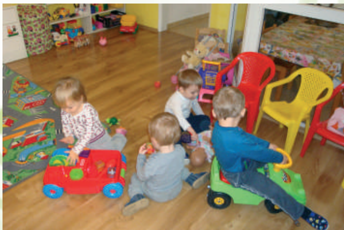
Naša najobľúbenejšia činnosť

Evanjelický cirkevný zbor Púchov – ani veľký, no ani nie až tak malý. V jeho areáli je zriadené a funguje už deväť rokov Stredisko Evanjelickej diakonie - Detské opatrovateľské centrum V. Roya, zamerané na pomoc mladým rodinám, a to službou starostlivosti o deti vo veku od jedného do troch rokov bez rozdielu vierovyznania ich rodičov. Niekto si môže povedať, že to nie je služba. Áno, to si povedali aj mnohí cirkevníci, čo je celkom pochopiteľné.