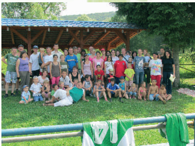
Spoločný Deň detí v Šáľkovej