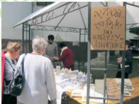
Predajom na podporu modranského sirotinca

Nadalej pokračuje zbierka predmetov z obdobia modranských sirotincov z rokov 1900 – 1950. Fyzická obnova budovy sa začne opravou vežičky v lete tohto roka, pretože tá je miestom, ktorým zateká do priestorov hlavného schodiska. Nadačný fond Slovenskej sporiteľne v Nadácii Pontis prispel 1000 eur na opravu vežičky, čím SLSP zdvojnásobila výťažok zbierky v zamestnaneckom grantovom programe Euro k euru.