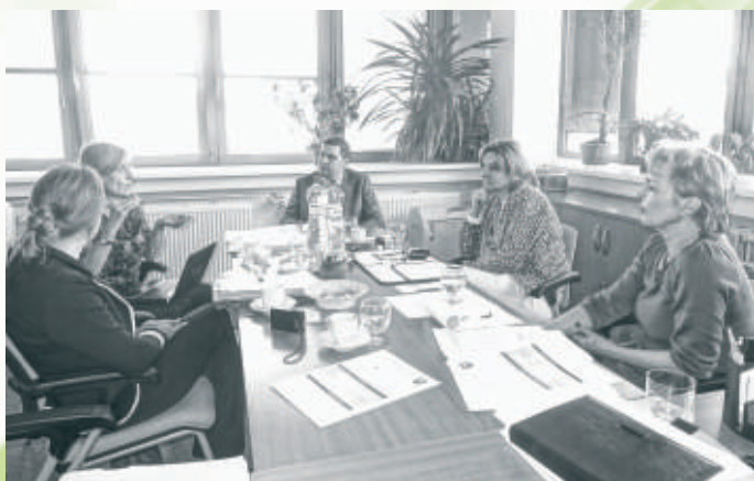
Stretnutie na Ministerstve práce, soc. vecí a rodiny SR