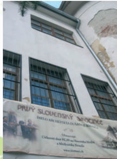
Budova bývalého sirotinca

Bývalý evanjelický sirotinec na Vajanského ulici v Modre navštívili v poslednú májovú sobotu architekti, historici, odborníci, pamätníci, návštevníci z Modry, ako aj príbuzní sirôt, ktorým dal sirotinec domov. Dobrovoľníci z OZ Modranskej Besedy a Cirkevného zboru ECAV na Slovensku v Modre postupne naplňujú cieľ obnoviť významnú budovu. Na obnovu sirotinca získali viac ako 800 eur.