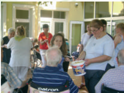
Spolu je nám dobre

Spolu s našimi seniormi, s ktorými zdieľame priestory a ktorých zapájame do našich aktivít, sa tu cítime ako doma. Sme medzi sebou priateľskí a navzájom sa vedíme k podpore. Keďže sa