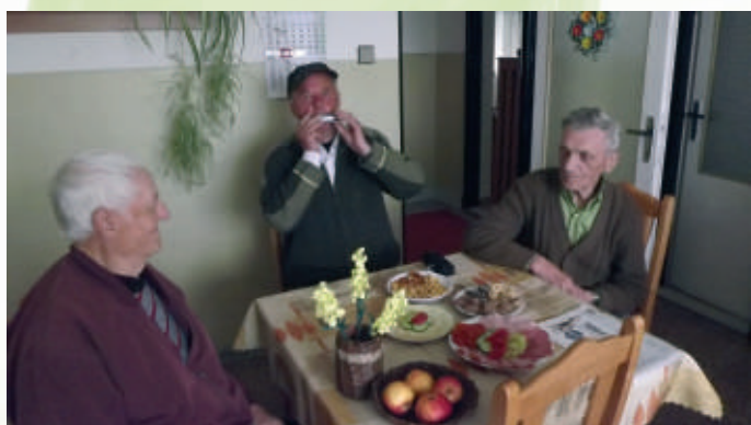
Život v Dennom stacionári

6. mája sme zorganizovali náš prvý spoločný výlet do Denného stacionára vo Veľkej Čalomiji. Rozhodli sme sa tak preto, že niektorí naši klienti pochádzajú z tejto dedinky. Boli medzi nimi aj takí,