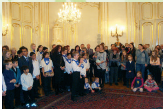
Detské vystúpenie na Mikuláša v Prezidentskom paláci

Duchovný rast je zabezpečený príslušným zborovým farárom v mieste bydliska profesionálnej rodiny. Rodiny sa aktívne zúčastňujú zborového života v mieste bydliska, deti chodia s profesionálnymi rodičmi do chrámu Božieho, navštevujú detské besiedky, mládež. Niektoré deti navštevujú spevokol miestneho CZ. Profesionálni rodičia učia deti kresťanským hodnotám, deti sa zúčastňujú výučby náboženstva v škole. Chcela by som sa poďakovať všetkým, ktorí nás duchovne, materiálne i finančne podporujú. Ďakujeme za ľudskú podporu, praktickú pomoc a povzbudivé slovo. Ďakujeme Pánu Bohu, že nám dáva silu k vykonávaniu služby.