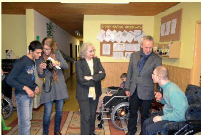
Evanjelická spojená škola internátna Červenica