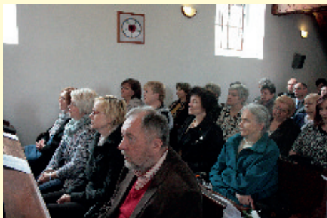
Priatelia a kolegovia diakonického strediska

Starostlivosť o deti je zabezpečená detskými sestrami, ktoré výchovno-opatrovateľskou činnosťou zabezpečujú správny duševný a telesný vývoj detí.