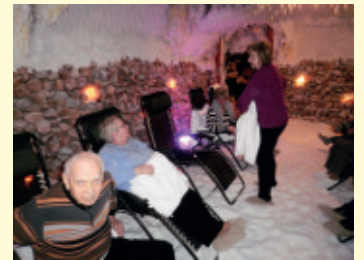
Relax v soľnej jaskyni

Z Božej milosti sme v Skalici 1. januára 2016 otvorili Denný stacionár určený predovšetkým seniorom. Pán Boh do našej starostlivosti zveril seniorov, ktorí už stratili svojich životných partnerov a rozhodli sa využitím sociálnej služby v Dennom stacionári prekonať samotu. Avšak prichádzajú ku nám aj seniori trpiaci Alzheimerovým ochorením či pacienti po cievnej mozgovej príhode. Všetci však chcú starobu vnímať ako ďalšiu etapu života, ktorú vďaka rôznym činnostiam v našom stacionári, môžu prežiť zmysluplne.