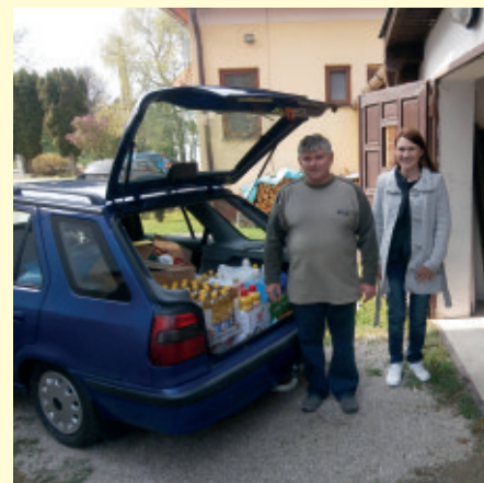
SED Kšinná -odovzdanie potravín

upriamil pozornosť svojich učeníkov na túto vdovu a pripomenul im, že táto vdova dala viac ako ostatní, ktorí dávali z prebytku. Tento príbeh je inšpirujúci, no v súčasnosti sa čoraz menej stretávame s nezištnou pomocou človeka človeku. Príbeh o chudobnej vdove nás v SED natoľko oslovil, že sme sa rozhodli pomôcť niekomu, kto pomoc nepýta, ale určite ju potrebuje. Klienti Denného stacionára sa rozhodli pomôcť klientom DSS v Kšínnej, kde ich počet neprekráča počet 18 a vieme, že je oveľa ťažšie zabezpečiť bezproblémový chod takéhoto zariadenia s nižším počtom klientov. Urobili sme zbierku, každý prispel