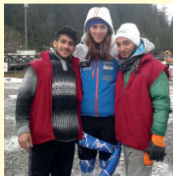
Ski World Cup Jasná 2016

a spoločenskými požiadavkami. Naším poslaním v Dome na polceste je s láskou týchto chlapcov viesť v živote a spoločnosti tak, aby nemuseli upadať do