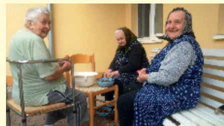
Radosť zo spoločnej práce

Naše klientky vo voľných chvíľach orechy rozbíjali, lúpali a tak pri spoločnej práci aspoň na chvíľu zabudli na všetky bolesti. Nebolo to ľahké, veď pri tom trpí chrbát aj prsty! Ale stálo to za to! Očistené orechy naše kuchárky zomleli a použili ich na spestrenie našej stravy. No neobišlo sa to ani bez voňavého kysnutého koláča, ktorý sme si všetci spoločne vychutnali a pri jeho konzumácii sme si pospomínali na to, aké koláče a dobroty sa doma piekli. Naše spoločne strávené popoludnie sa neobišlo ani bez spoločného spevu a rozprávania rôznych príbehov. Vôňa sladkého koláča sa rozplývala a potešili sa aj tí, ktorí nemohli pre svoj zdravotný stav prísť k nám do spoločenskej miestnosti. Koláč nám všetkým chutil a určite si to zopakujeme.