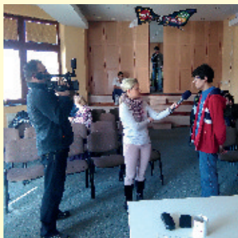
Záverečný workshop projektu Dom na polceste – rovnosť pre všetkých v ňom

V práci s našimi chlapcami sa aj my viac a viac učíme pracovať s láskou, lebo láska nezaspúje, ale spôsobuje, že človek vidí. Nie je naivná, ale vidí v človeku krásu i jeho nedokonalosť, slabosť. Verím, že ak budeme naďalej hľadať na našich klientov očami lásky, uvidíme ako sa dokážu zmeniť, pracovať, byť zodpovední. Všetci potrebujeme k životu lásku. Lásku sprostredkovanú slovom a činom. Tou láskou je Boh. Môžeme teda s apoštolom Pavlom vyznať: „Ale Boh dokazuje svoju lásku k nám tým, že Kristus umrel za nás, keď sme boli ešte hriešni.“ Rím 5,8. Pán vidí naše zlé myšlienky, rozhodnutia, konanie, ale napriek tomu nás miluje bezpodmienečnou láskou. Stále vidí možnosť zmeny v nás, zmeny na Jeho obraz. Spoločne by sme mu mali teda odpovedať.