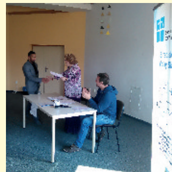
Odovzdávanie certifikátov zo školenia

Podobne sme úspešne ukončili projekt – Dom na polceste – rovnosť pre všetkých v ňom , kde sme sa naučili mnohým novým zručnostiam, ako aj asertívnemu správaniu. K úspešnému ukončeniu projektu patrilo aj víkendový pobyt v Liptovskej Tepličke v penzióne Dolinka.