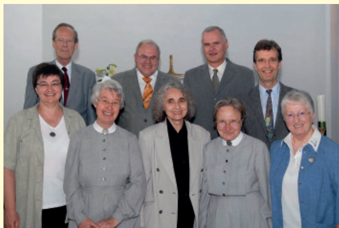
Predstavitelia ED s nemeckými partnermi