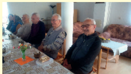
Voňavý a chutný výsledok

Tak sme sa aj tento rok potešili „plnému vrecu orechov“, ktoré prinieslo so sebou záblesk spomienok a chuti do práce.