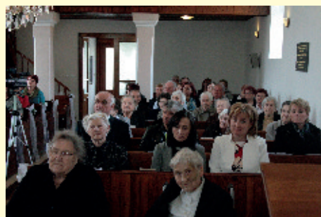
Zamestnanci a klienti SED Kšinná