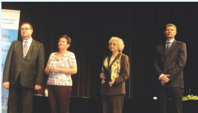
25.výročie Evanjelickej diakonie

štát vyžaduje od niekoho, kto chce robiť činnosti, ktoré sú štátom definované ako sociálne služby. Tu už musí nastúpiť diakonia ako organizácia a až prostredníctvom nej svoju službu poskytovať. Uply- nulých 25 rokov ukázalo, že napreduje v oboch „typoch“ diakonie. Na základe toho, môžeme pove- dať, že spolupráca je na dobrej úrovni. Pozitívne vnímam najmä skutočnosť, že pri pozvaniach do cirkevných zborov „cítiť“ ochotu počúvať nás, aby diakonia a diakonická práca bola pre cirkevné zbory prínosom, a nie záťažou.