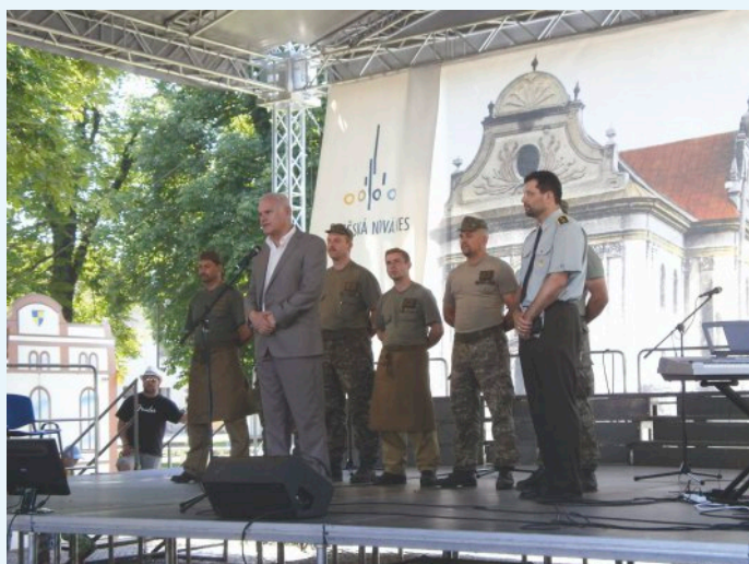
IV. Ev. cirkevné dni v Spišskej Novej Vsi

konfesie, a to ľudia často prekvapuje. Stále platí, že keď má niekto problém, bolesť a pomôžete mu ho riešiť, minimálne sa zamyslí, prečo to robíte a tu potom, ak sa pýta, je možnosť svedčiť.