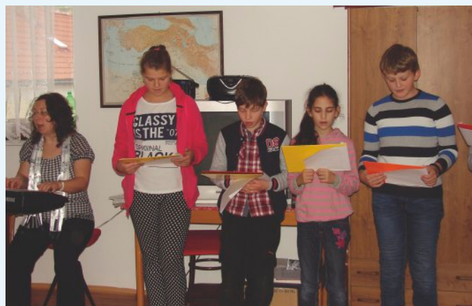
Detský spevokol Dúha

možnosť a silu sa takto stretávať. Komu zdravotný stav nedovolí prísť medzi nás, pani farárka ide k nemu na izbu a zvlášť poslúži Božím slovom.