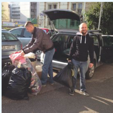
Pri humanitárnej pomoci

dza cirkev od jej prvo- počiatku. S týmto ty- pom diakonie – služby sa stretávame v bežnom živote CZ ECAV a ani si to nemusíme uvedomo- vať. S rozvojom spolo- čnosti prichádzajú nie- len výhody, ale aj pre- kážky. Medzi takéto prekážky môžeme zara- diť aj požiadavky, ktoré