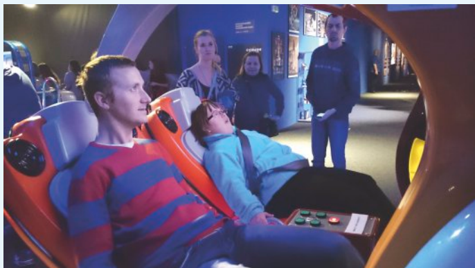
A letíme ...

a mnohé iné projekty svetových kozmických agentúr. Na záver výstavy v priestore interaktívnej playzóny Cosmocamp sme si niektorí z nás vyskúšali kúsok z náročného výcviku kozmonautov.