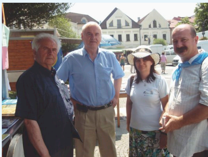
II. Ev. cirkevné dni v Žiline

konfesie, a to ľudia často prekvapuje. Stále platí, že keď má niekto problém, bolesť a pomôžete mu ho riešiť, minimálne sa zamyslí, prečo to robíte a tu potom, ak sa pýta, je možnosť svedčiť.