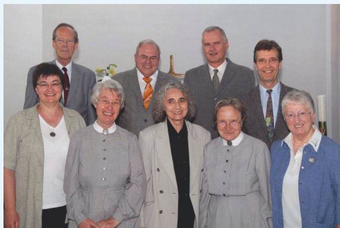
S nemeckými partnermi

Rád spomínam na spoluprácu s každým, kto naozaj chcel pracovať. Vzor sme mali v nemeckej cirkvi, kde je diakonická práca na vysokej úrovni. Oni nám ukázali, že treba chcieť a potom to ide a po čase prídu výsledky.