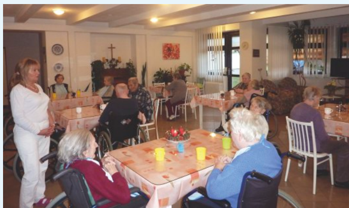
Prvá adventná nedeľa

Posledná novembrová nedeľa je zároveň 1. adventnou nedeľou, čo značí aj začiatok cirkevného roka. V našom zariadení sme po raňajších modlitbách spoločne zapálili na adventnom venci, ktorý sme s klientami vyrobili 1. adventnú sviecu. V tento adventný čas prichádza Pán, aby nás zachránil, aby sme