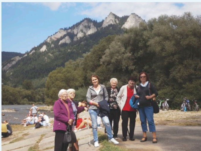
V objatí Pienin

Vo Vranove nad Topľou v Dennom stacionári sa dennodenne stretávajú seniori, ktorí sa tešia na spoločné stretnutia. Sú to väčšinou osamelo žijúci seniori. V našom zariadení sa im snažíme spestriť ich „jeseň života“. Spoločne sa stretávajú, porozprávajú sa, posťažujú, pospomínajú, nadviažu nové známosti a ich život sa tak i napriek veku stáva hodnotnejším. Výhodou pre seniorov, ktorí navštevujú náš Denný stacionár je zabezpečenie kontaktu so spoločenským prostredím, aktivizácia, podpora samostatnosti a sebestačnosti a tak zamedzenie spoločenskej izolácie. Dôraz kladieme aj na duchovné nasýtenie pri ranom modlitebnom stíšení počas týždňa. V piatky navštevuje náš kolektív pán farár. V prvom rade sa snažíme, aby sa naši seniori cítili ako „doma“ v ich prirodzenom prostredí, ale tiež spríjemňujeme klientom pobyt a to organizovaním rôznych kultúrno-spoločenských podujatí a výletov.