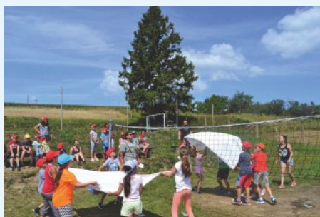
Zábava nám nechýbala

Spomienky na zábavu, hry, rozhovory, bláznenie sa, ale hlavne na zvesť o Kristovi. Každý deň zaznieva deťom evanjelium, každý deň môžu počuť o Božej láske k nim. Na týchto táboroch vzniká veľa priateľstiev, ale aj kresťanov.