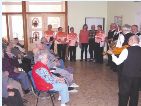
Radosť našich seniorov

Pán starosta nepotešil len slovom, ale aj vitamínmi, ktoré sú v každom období života dôležité. I za tento prejav rozdelenia sa s blížnym, ďakujeme. Určite je medzi nami veľa tých, ktorí sú vďační za každé milé slovo a prejav záujmu. Ľudské srdce, zvlášť keď je životom utrápené, vie oceniť veci, ktoré mladá generácia často prehlíada a nepripisuje im dôležitosť. Až v starobe spoznajú, pravé hodnoty života.