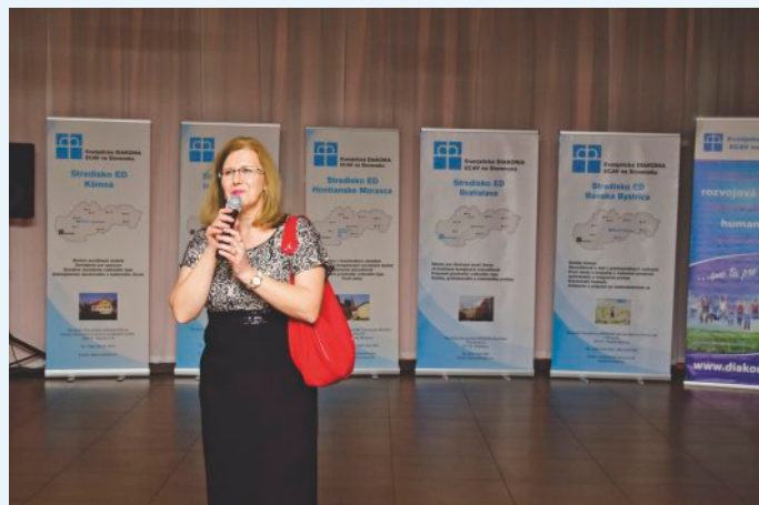
Z osláv 25. výročia ED

o pomoc či už materiálnu, finančnú, alebo personálnu – vypočuté. Každý za seba by určite mohol dovedieť, kedy, pri akej príležitosti pocítil či priamo zažil Božiu žehnajúcu ruku. V Trnave to bolo napríklad, keď sa po takmer 10 rokov trvajúcich zápasoch o vybudovanie domova dôchodcov podarilo nakoniec budovu, ktorá sa vrátila cirkevnému zboru v rámci reštitúcií, opraviť a 4. júna 2006 uviesť do prevádzky diakonický domov dôchodcov. Takže v Trnave sme toho roku oslávili 10. výročie od tejto udalosti. Vďaka Evanjelickej diakonii našlo veľa detí domov, mladých ľudí zmysel života, seniorov opateru a prostredie pre pokojnú starobu. Diakonia poskytuje pomoc pri živelných pohromách doma i v zahraničí, humanitárnu pomoc. Tento výpočet iste nie je úplný, je mi, ale potešením, že som mohla prispieť k tejto službe, či už ako predsedníčka správnej rady alebo ako radová členka ECAV na Slovensku.