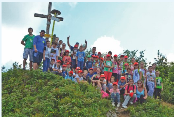
Výstup na vrchol

mohlo zúčastniť každé dieťa, ktoré má záujem. Pre niektoré deti, je to jediný tábor, na ktorý v lete idú, lebo si ho ich rodičia môžu dovoliť. Na druhej strane, je to pre najmladších z nášho cirkevného zboru akási „povinná jazda“. Práve vďaka tomuto, sa tu miešajú najrôznejšie charaktery, názory na Boha, skúsenosti, ale často aj smutné osudy. Mnoho detí na začiatku tábora drží v rukách prvýkrát Bibliu, iné naopak poznajú mnoho biblických príbehov a Ježiš je pre nich najlepší priateľ. Tento rok bol témou Výstup na vrchol. Spolu s biblickými postavami sme vystupovali na rôzne vrchy, na ktorých sa v Biblii odohrali významné udalosti.