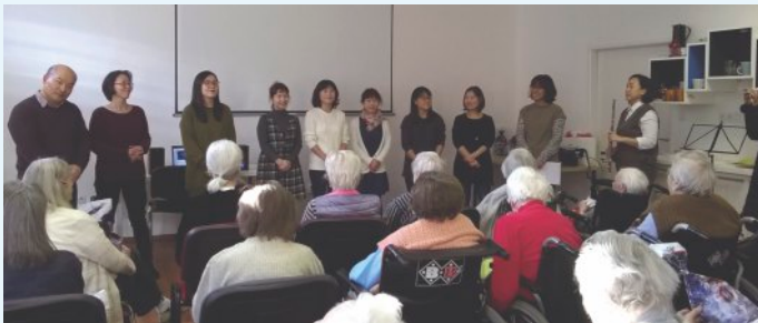
Radosť z hudby

Dozvedeli sme sa, že bratia a sestry z Kórei majú v Bratislave kongregáciu o veľkosti 80 členov a stretávajú sa v priestoroch Evanjelickej teologickej fakulty UK.