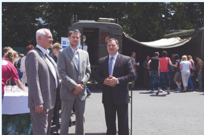
IV. Evanjelické cirkevné dni v Spišskej Novej Vsi

Rok 1989 predstavoval veľkú zmenu, umožnil realizovať veci, ktoré dovtedy boli nemysliteľné. Bolo to obdobie eufórie z toho, čo všetko bude možné, čo všetko nám to prinesie. Mysleli sme predovšetkým na pozitívne veci, až tie negatívne skutočnosti, ktoré neskôr nastali, nás vrátili „na zem.“ Nevieť posúdiť, do akej miery si ľudia, ktorí boli za obnovením činnosti Evanjelickej diakonie tým, že zriadili novú organizáciu uvedomovali, aký výrazný prvý krok pre obnovenie diakonickej práce v ECAV urobili. Som veľmi rád, že na tento ich počin, Evanjelická diakonia už ako organizácia úspešne nadviazala. Dnes máme 22 Stredísk evanjelickej diakonie, zamestnávame cca 365 zamestnancov, poskytujeme služby cca 800 klientov. Okrem toho tu máme ešte humanitnú, rozvojovú pomoc, dobrovoľníctvo a vzdelávanie. Som presvedčený o tom, že tých 25 rokov sa nám podarilo vo veľkej miere využiť na obnovenie diakonickej práce v ECAV, ktorá bola v predchádzajúcich 40 rokoch nemožná.