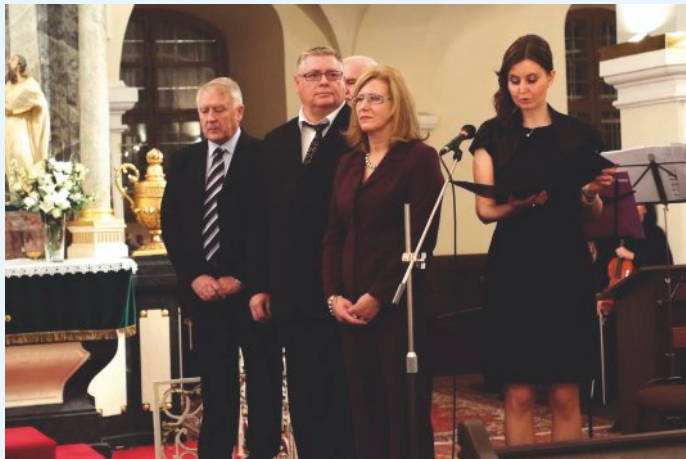
Ocenenie Zlatým odznakom ED

dopadu na kvalitu alebo rozsah poskytovaných služieb. Evanjelickej diakonie sa stala značkou kvality a verím, že tento trend si udrží aj naďalej.