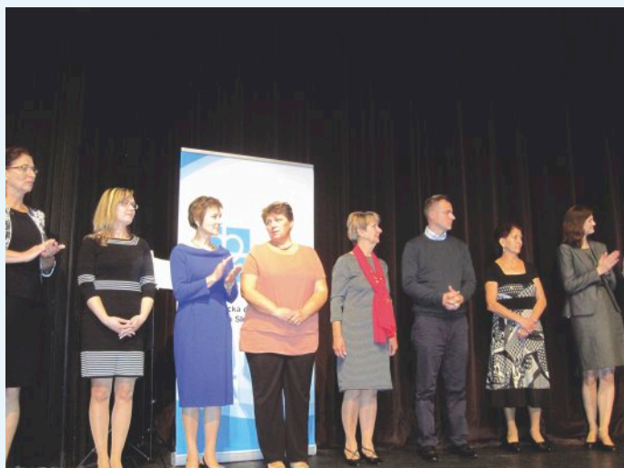
Naši úspešní pracovníci