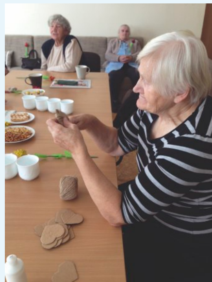
Naše šikovné seniorky

Opäť nám po čase prichodí nanajvýš realisticky kon- štatovať, že sa blí- ži koniec ďalšieho kalendárneho roka. Ďalšia časť nášho života. V takomto čase viac ako inokedy hľadáme späť na uzatvárajúce sa obdobie a bilan- cujeme. Pohľad „späť“ nás melan- cholicky uisťuje, že odchádzajúci čas sa už nikdy nevráti. Niekedy nás toto pomyslenie upokojuje, inokedy možno desí.