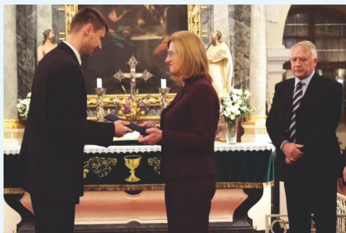
Z ocenenia pri 20. výročí ED

Každá z týchto skupín, ktorú ste vymenovali, má svoje špecifiká a každá z nich si vyžaduje osobitný prístup. Bezdomovcom sa venuje nielen tretí sektor, ale aj samosprávy a pomoc pre nich je relatívne najlepšie zorganizovaná. Je len prirodzené, že medzi organizácie pomáhajúce bezdomovcom patrí aj Evanjelickej diakonie. Okrem bezdomovectva považujem v súčasnosti za nevyhnutné zapojiť sa aj do pomoci utečencom. A to o to viac, že sa osudy týchto ľudí spájajú s tzv. utečeneckou krízou a so strachom z hroziaceho terorizmu. Strach by nás, ale nemal oberať o rozmer ľudskosti, nemali by sme zabúdať, že ako kresťania sme povinní pomáhať. Práve pomoc v krízových situáciách, bez ohľadu na rasovú alebo národnostnú príslušnosť, je príležitosťou dokázať, že nezabúdame na Kristove prikázanie lásky a že naša viera je skutočná. Podobne to platí aj pre marginalizované komunity.